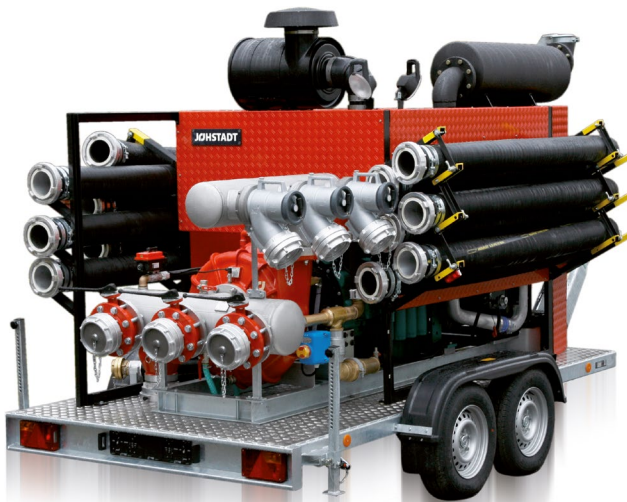
Basisvariante mit Schlauchlagerung Basis cover with hose storage