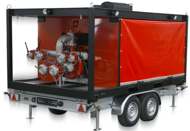
Einzel aufstellbarer Container Separately usable as container