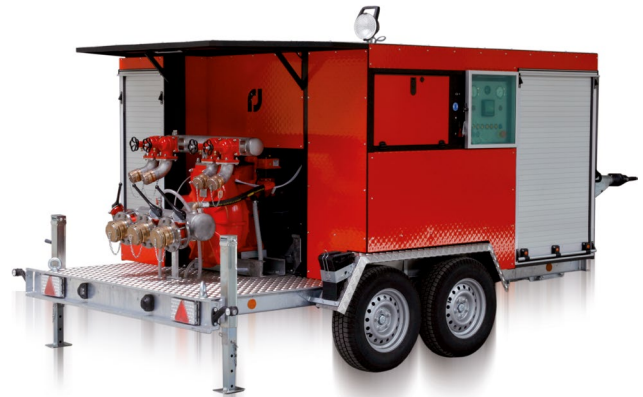
Vollverkleidung Full cover