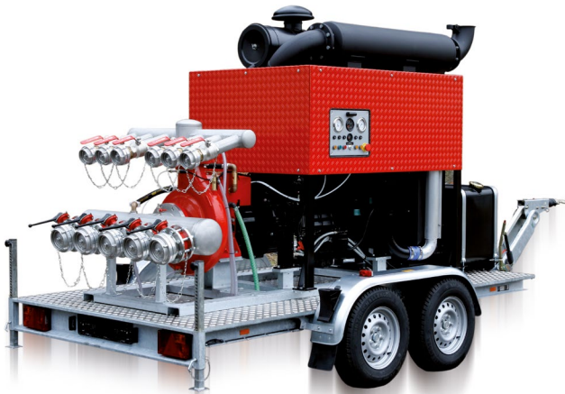
Basisvariante Basis cover